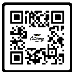
Broodjes & Bonnen

Drank betaal je contant, via Bancontact of je koopt uiterlijk 3 maart bonnen (factuur) via de QRcodes. Broodjes of een warme lunch bestel je uiterlijk 4 maart via deze code.