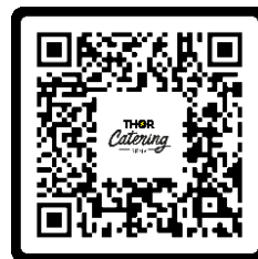
Warme Lunch & Bonnen